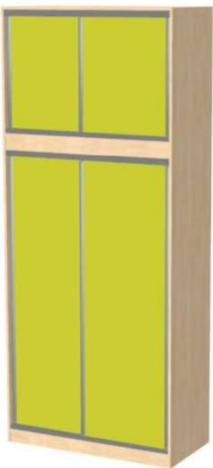
5 + 6