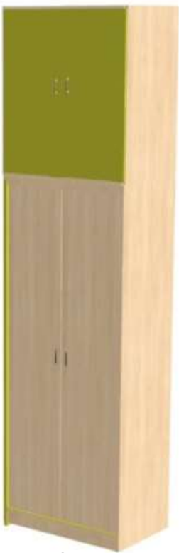
7 + 8