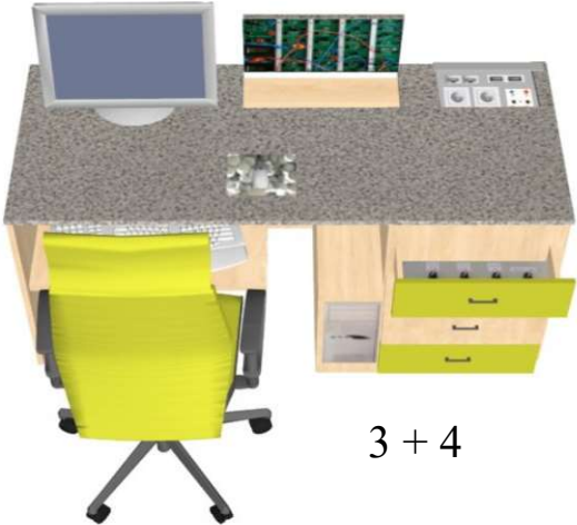
3 + 4